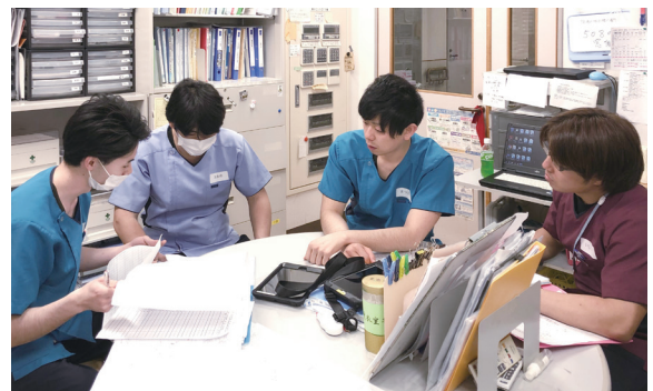
令和への改元は、夜勤シフトでスタート (夜勤前のミーティング風景)